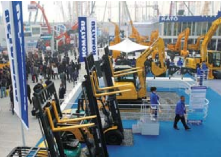
Komatsu mostró los productos de las compañías del Grupo entre los que se incluyen montacargas de horquilla.