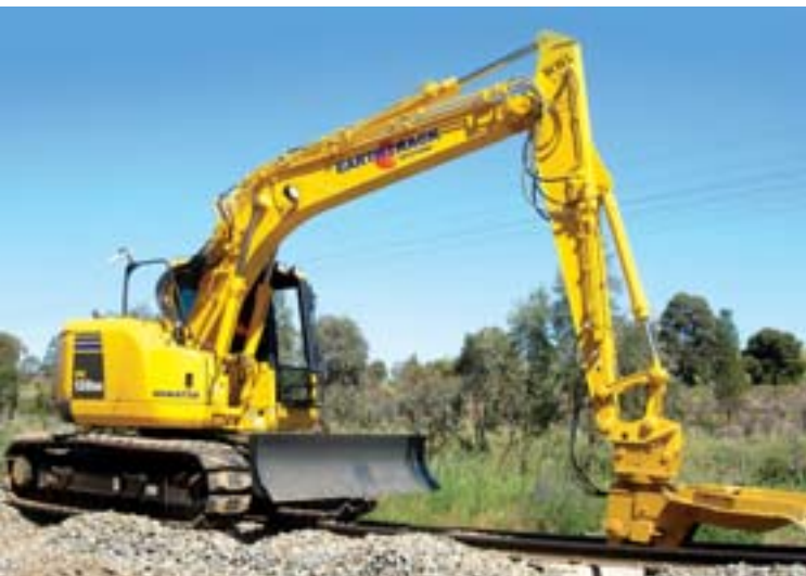
La PC138US modificada para rieles demuestra ser sumamente versátil.

Por Wafaa Ghali, Komatsu Australia Pty. Ltd.