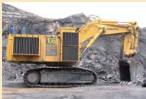
El sistema XS250 de Hensley se está utilizando en la excavadora hidráulica Komatsu PC3000.

El sistema XS250 de Hensley se está utilizando en dos excavadoras hidráulicas Komatsu PC3000 que se encuentran en operación en la Mina de Carbón de Muswellbrook en Australia. Aunque las máquinas ya han registrado más de 14.000 horas, el sistema XS250 sumamente confiable continúa entregando un rendimiento uniforme. Al mismo tiempo, el adaptador de esquina, que soporta una carga pesada durante la excavación, se ha reemplazado por el resistente 550XS250 después de haber sido utilizado durante más de 10.000 horas. Los dientes de cucharón XS250RC se pueden