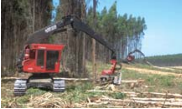
Timbercorp usa equipos cosechadores 430FX para trabajar en sus plantaciones forestales.

reforzado en todos los aspectos, dándole al mismo una confiabilidad más consistente. Los rodillos de alimentación excéntricos continúan haciendo que el descortezado sea un trabajo fácil”.