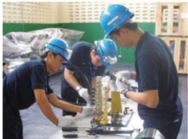
Cuando practican el apriete de mangueras de codo atornillable, los participantes en la capacitación aprietan primero el perno manualmente y confirman a continuación el apriete usando una llave de torsión.