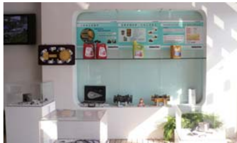
Exhibición de las partes Komatsu genuinas