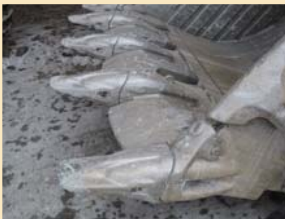
La condición exigente del suelo causa a menudo un desgaste pesado en los dientes del cucharón.

El sistema GET XS342 grande de Hensley se está utilizando en las excavadoras hidráulicas R994B fabricadas por Liebherr que se encuentran en operación en la Mina de Carbón de Ashton en Australia. La condición del suelo varía ampliamente en este sitio, y abarca desde áreas con una carga liviana en los equipos hasta áreas más exigentes que causan un desgaste pesado. Los dientes de cucharón XS342RC se han utilizado durante aproximadamente 900 horas desde el comienzo y han demostrado resultados excelentes en estas condiciones duras. El cliente ha alabado muy especialmente la forma de la cubierta de desgaste que protege la parte superior del adaptador y la confiabilidad del pasador que sujeta los dientes al adaptador.