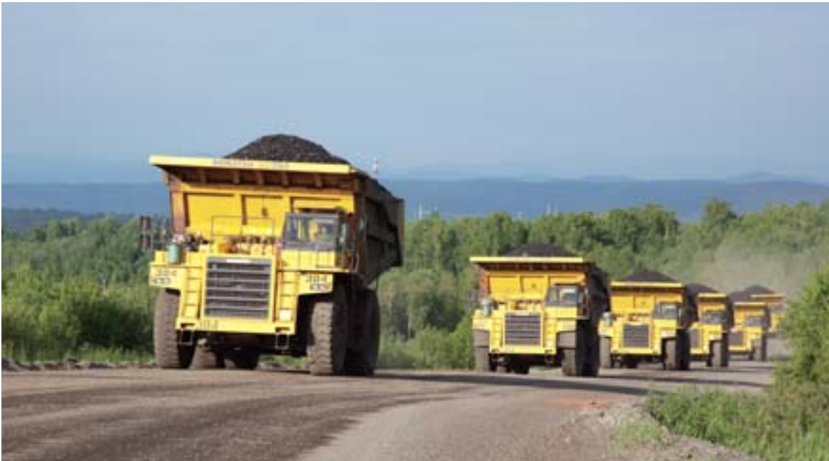
Camiones volquete Komatsu HD785 en operación en la mina de carbón de OAO UK Kuzbassrazrezugol (KRU) en la región de Kemerovo