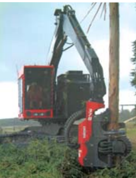
Longitudes de árboles enteros se cosechan haciendo uso de un cabezal cosechador de gancho único Valmet 378.

continúa es otro impulsor clave de los negocios tanto para las operaciones forestales como las industriales.”