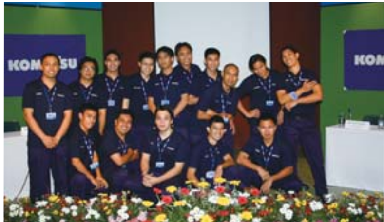
Nuevos reclutas prometedores del Komatsu Human Resources Development Center (Philippines)