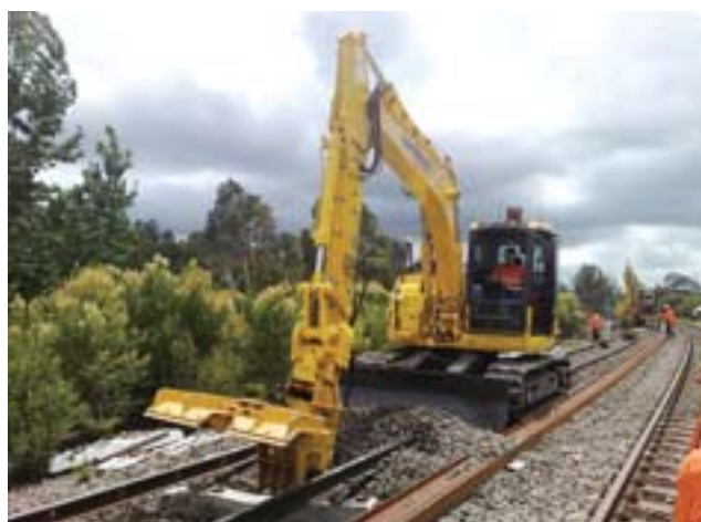
La PC138US con un accesorio Platypus utilizada en el proyecto de mejora de los ferrocarriles nacionales de Australia