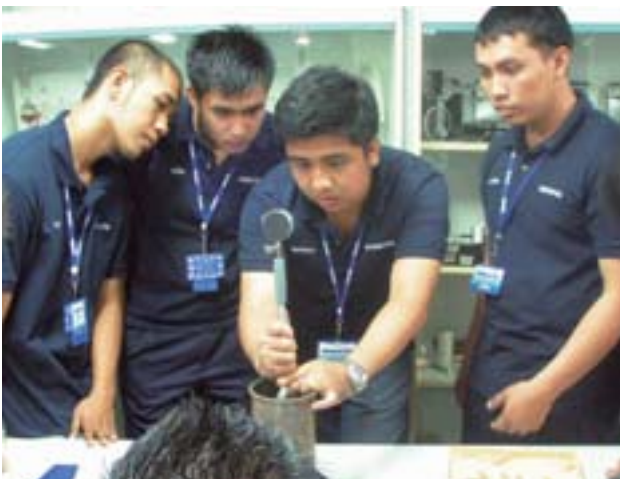
La capacitación en medición de alta precisión de diámetros interiores usando un calibrador para diámetros interiores