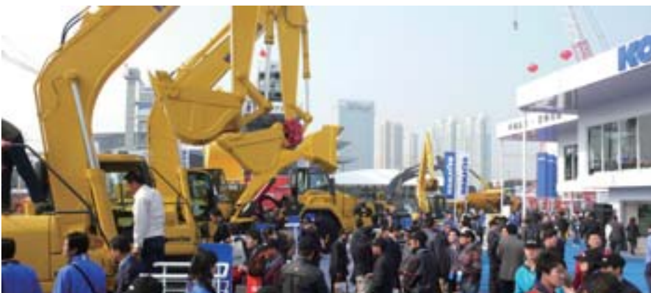
El puesto de Komatsu recibe numerosos visitantes en bauma China 2008.

Komatsu presentó un total de 14 máquinas. El equipo de construcción y minería en exhibición incluía