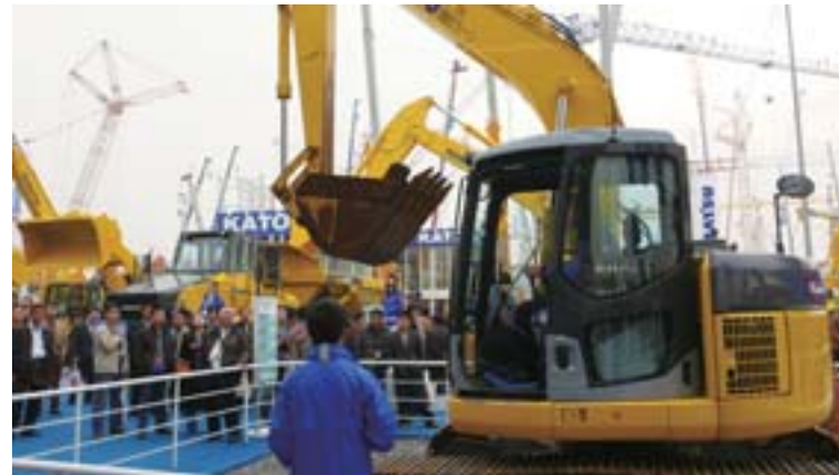
Los visitantes mostraron mucho interés en la versatilidad y agilidad de la excavadora hidráulica PC128US usada.

* Para mayor información sobre bauma China 2008, visite el sitio de Internet que se indica a continuación: www.bauma-china.com